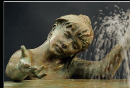
Garçon, fillette et fontaine ▷ bronze, h. 134 cm