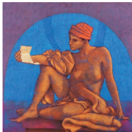
La lettre, pastel et gouache, 80 x 80 cm, 2011. Le chemin vert, pastel et gouache, 50 x 60 cm, 2012. ▷